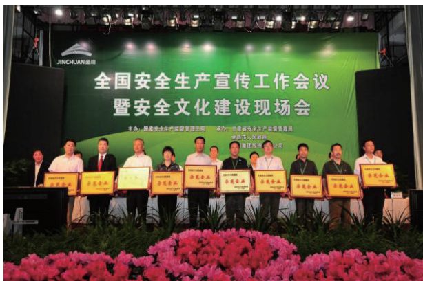
图1 全国安全文化企业评审

我国越来越多的企业在生产实践过程中开展了安全文化建设工作,行业覆盖了矿山、石化、建筑、冶金、道路交通运输、铁路、航空、机械、电子、电力、建材等。企业管理人员和安全管理对安全文化的认知程度超过了90%,认同文化管理是安全管理的最高层次和最高境界。